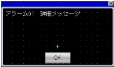
ウィンドウ画面 W-30001 : アラーム詳細