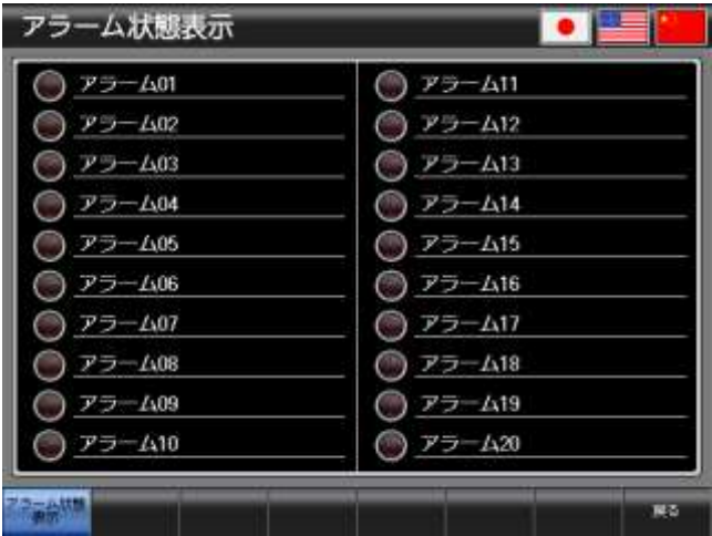
ベース画面 B-30001 : アラーム状態表示 1