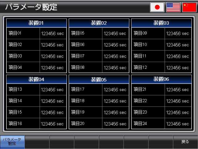
ベース画面 B-30001 : パラメータ設定 1