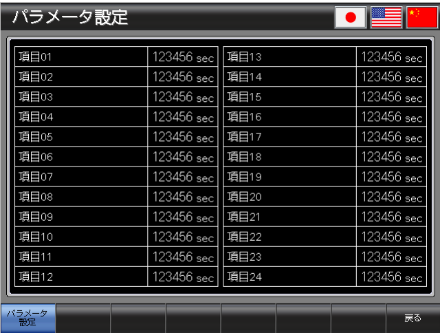
ベース画面 B-30002 : パラメータ設定 2