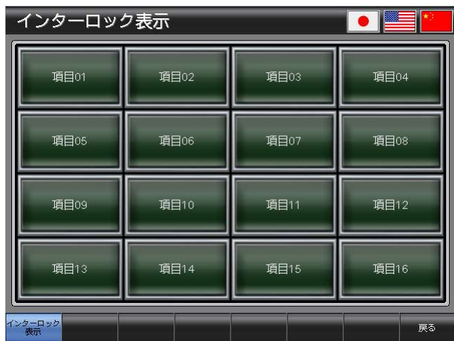
ベース画面 B-30002 : インターロック表示 2