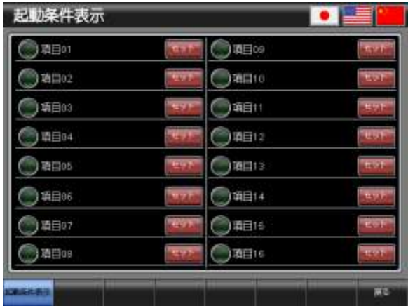
ベース画面 B-30003 : 起動条件表示 3