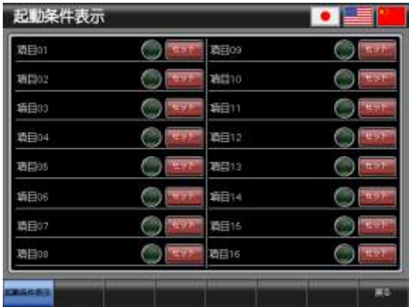
ベース画面 B-30004 : 起動条件表示 4