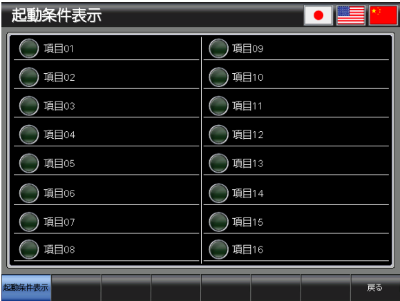
ベース画面 B-30001 : 起動条件表示 1