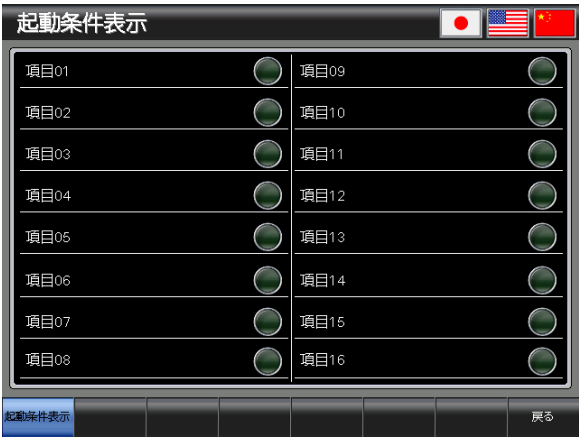
ベース画面 B-30002 : 起動条件表示 2