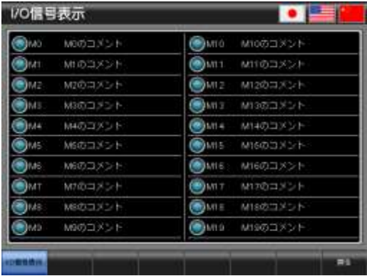
ベース画面 B-30004 : I/O 信号表示 4