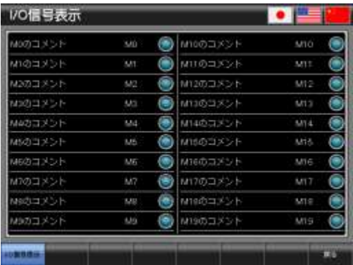
ベース画面 B-30003 : I/O 信号表示 3