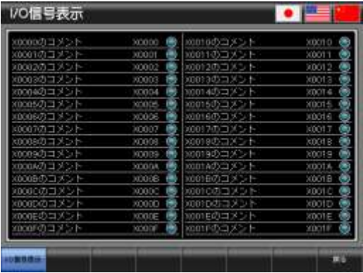
ベース画面 B-30001 : I/O 信号表示 1