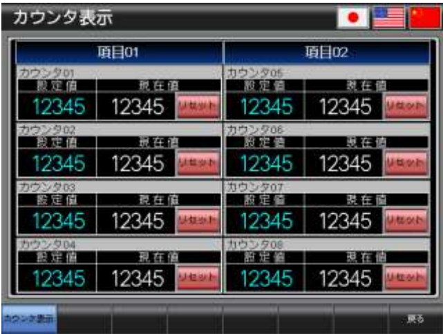
ベース画面 B-30001 : カウンタ表示 1