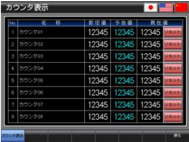
ベース画面 B-30003 : カウンタ表示 3