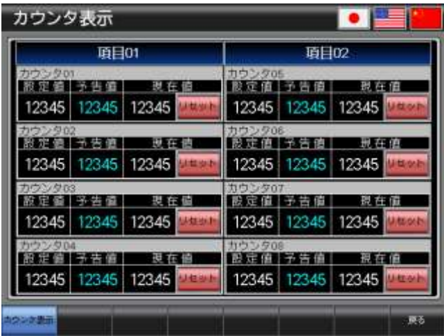
ベース画面 B-30002 : カウンタ表示 2